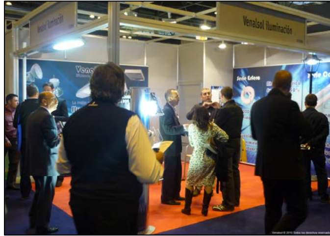
Stand en el Salón internacional de material eléctrico y Electrónico. Stand at International Fair of Electrical and Electronic Material.

La presentación de la iluminación por inducción Venalsol® en la 15ª edición del Salón Internacional de Material Eléctrico y Electrónico -MATELEC- celebrada del 26 al 29 de Octubre de 2010 en IFEMA, ha superado con creces todas las expectativas de éxito planteadas, de proyección de la marca y sus productos tanto a nivel nacional como internacional con países como México, Venezuela, Chile, Perú, Bolivia, Marruecos, Portugal, Argelia, Aruba, Holanda e Italia que han quedado gratamente sorprendidos por las características de ahorro energético, reducción de costes de mantenimiento y el alto nivel de confort lumínico de esta tecnología.